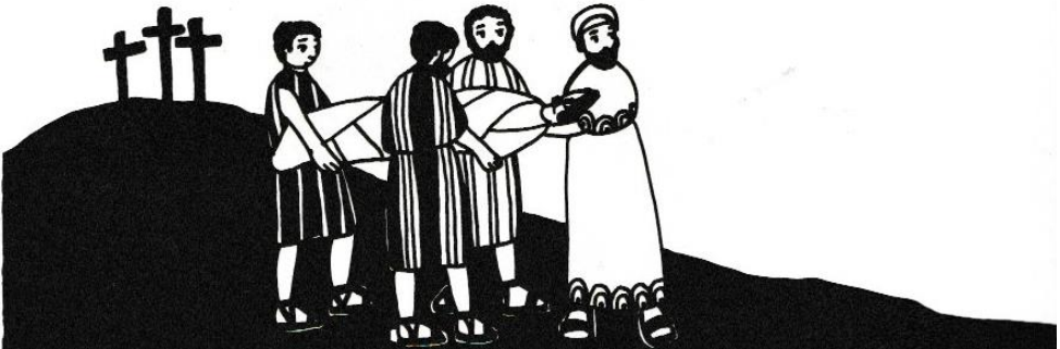
Josef en de zijnen dragen Jezus naar zijn graf