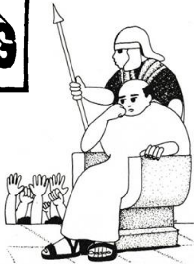
Pilatus op zijn rechterstoel

Jesus' IS GEEN mislukking MAAR de: enige OPLOSSING