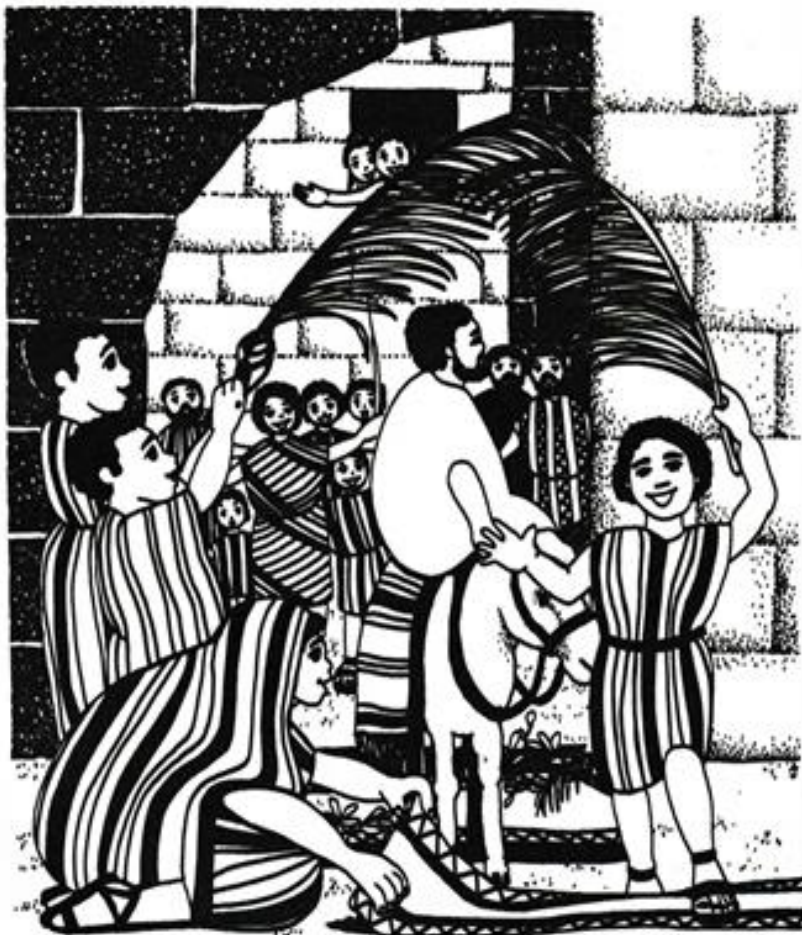
Jezus' intocht in Jeruzalem op een ezel